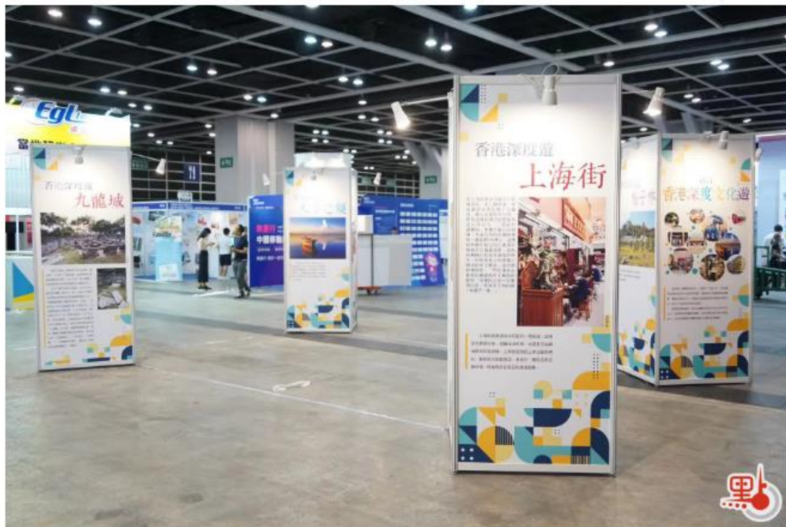
現場有展示架介紹香港深度遊。

主辦機構介紹，中國內地展團繼續成為本屆旅遊展面積最大、人數最多的展區。國家文化和旅遊部組織20個省（區、市）文化和旅遊部門及企業參展，當中包括9個省市是特裝展台。他們亦會帶來更多豐富的民俗表演，包括歷史悠久、於兩米高樁柱表演的南海舞獅，以及聯合國教科文組織非物質文化遺產表演。