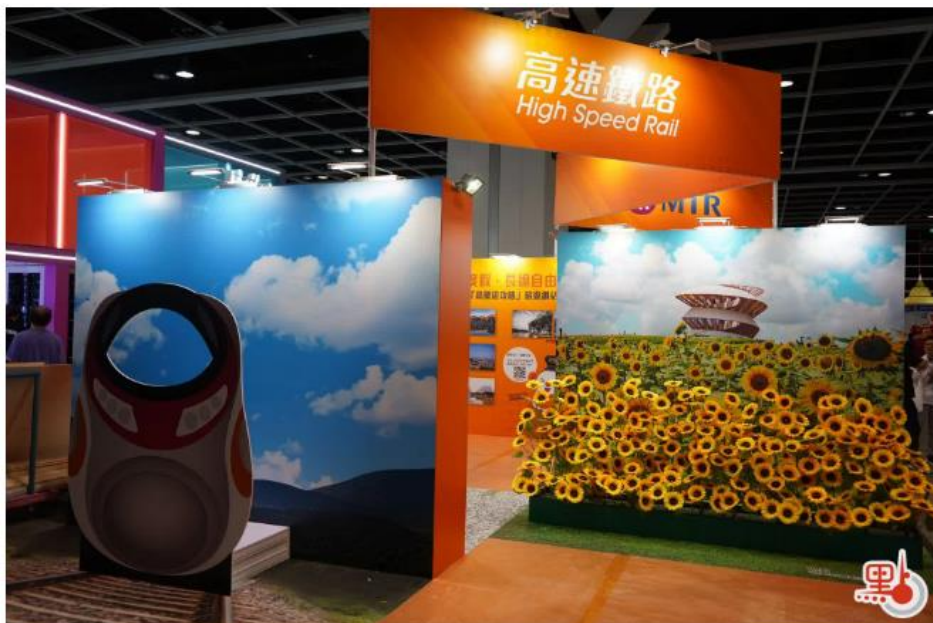
現場設展區介紹乘搭高鐵旅遊攻略。