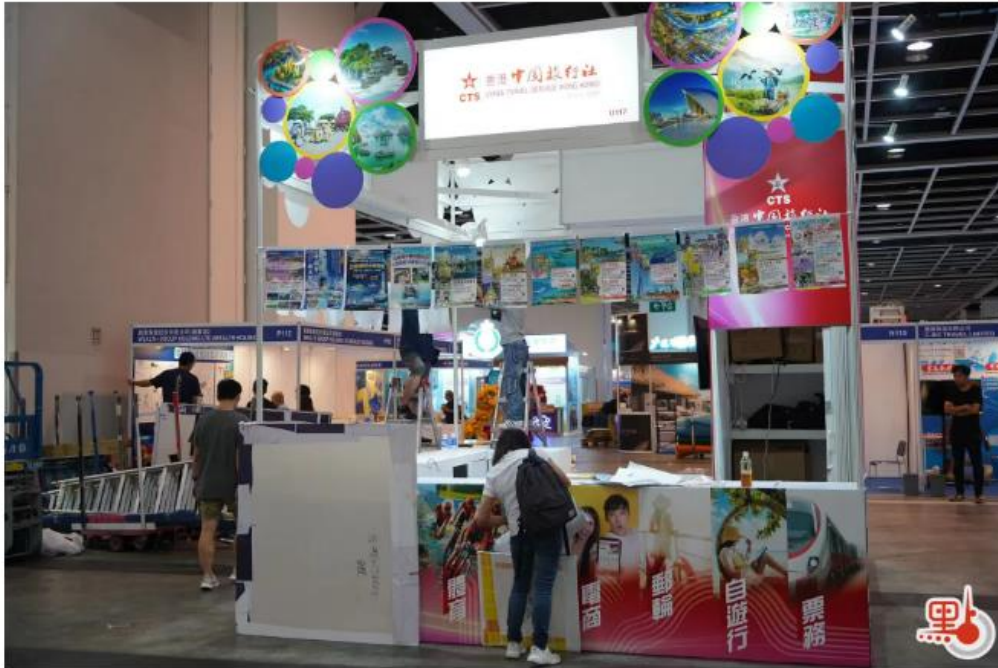
香港國際旅遊展2023將於6月15至18日與會展中心舉行。

【點新聞報道】香港國際旅遊展2023將於明日(15日)起一連4日在灣仔會展中心舉行!今屆旅遊展匯集逾400個的參展商,當中超過七成來自境外或海外地區,其中亦有約3成是首次參展。各國參展商除了介紹全球多個地區旅遊資訊,更會免費派發贈品、推出抽獎活動,讓大家可以免費獲得機票及酒店住宿。