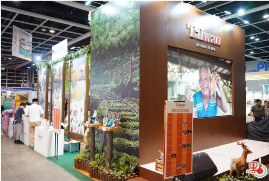
台灣地區展台。