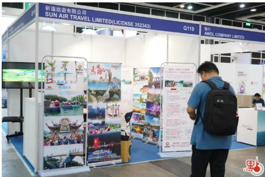
今屆旅遊展匯集逾400個的參展商。

【點新聞報道】香港國際旅遊展2023將於明日(15日)起一連4日在灣仔會展中心舉行!今屆旅遊展匯集逾400個的參展商,當中超過七成來自境外或海外地區,其中亦有約3成是首次參展。各國參展商除了介紹全球多個地區旅遊資訊,更會免費派發贈品、推出抽獎活動,讓大家可以免費獲得機票及酒店住宿。