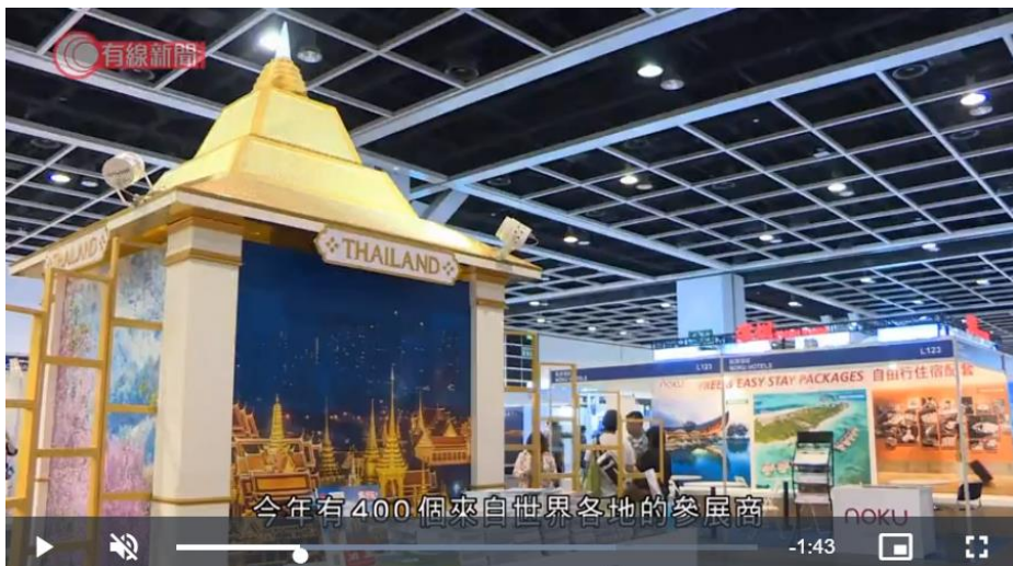
今年有400個來自世界各地的參展商