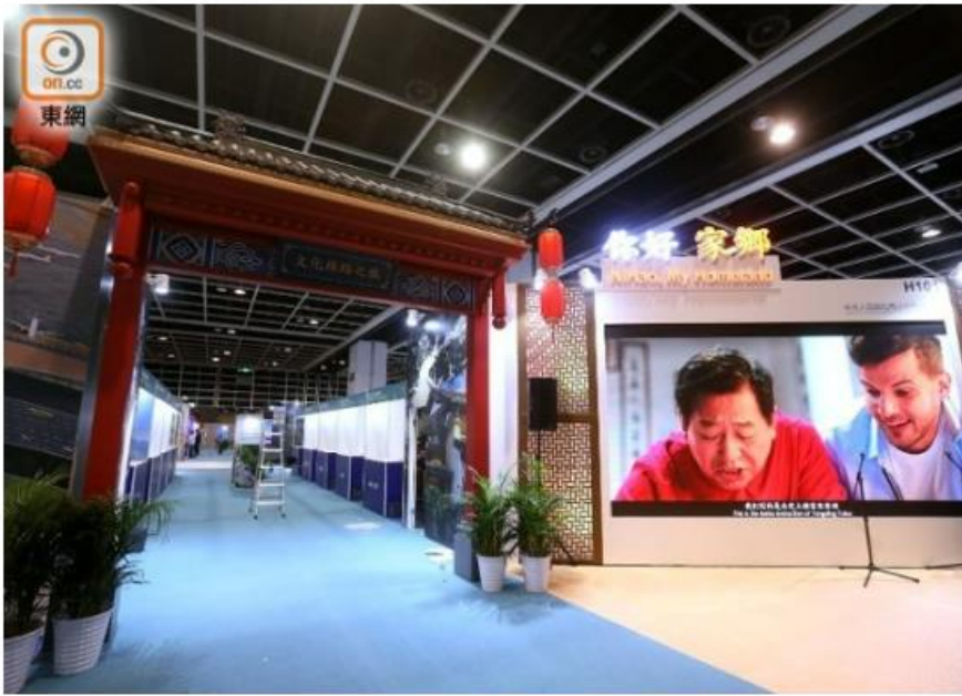
首個國際旅遊展將於明日起一連4日於會展舉行。