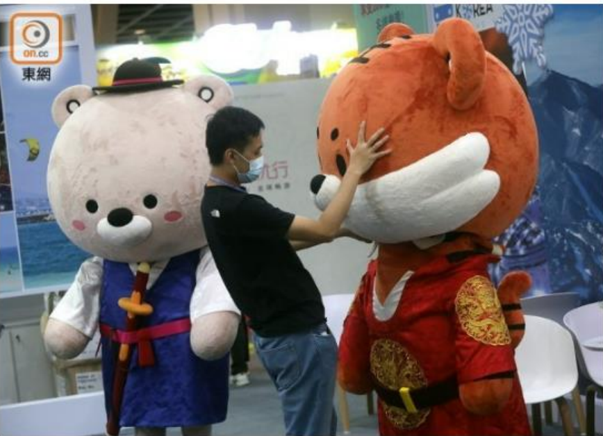
南韓攤位準備派出兩隻穿上傳統服飾的吉祥動物坐鎮。