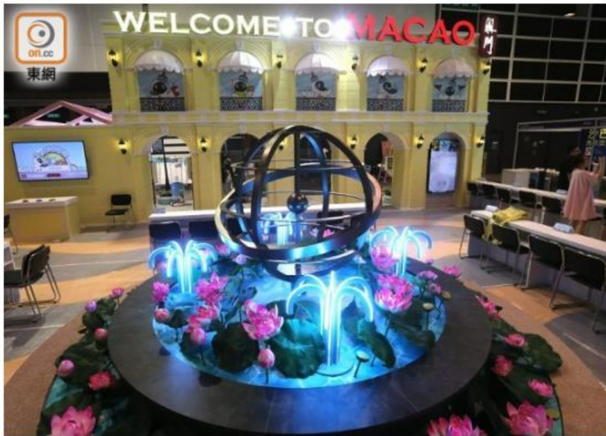
澳門攤位搭建葡式建築、仿蓮花池。