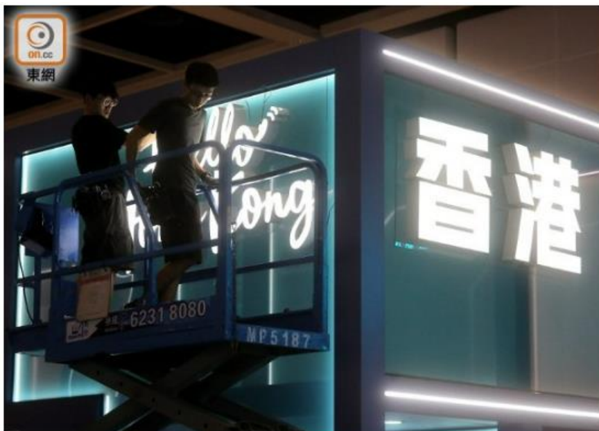
各工作人員均積極布置攤位。