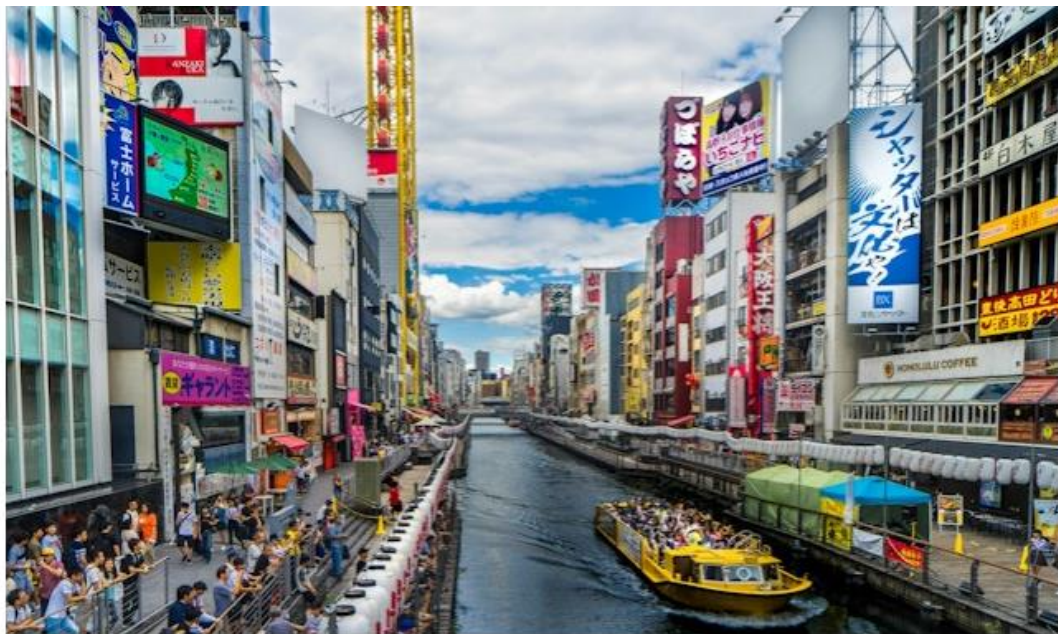
今屆旅遊展將有近499個來自59個國家及地區的商家參展。

今屆旅遊展將在會展1號館舉行，有別去年採用4個展廳，今年將擴大規模至五個展廳（1A至1E）。館內大致可分為4大部份，1A及1B展廳主要為中國內地參展商；1C展廳為香港、澳門、台灣、韓國等亞洲地區展商；1D展廳主要為歐洲、美洲、非洲及中東地區展商；1E展廳為日本展區。