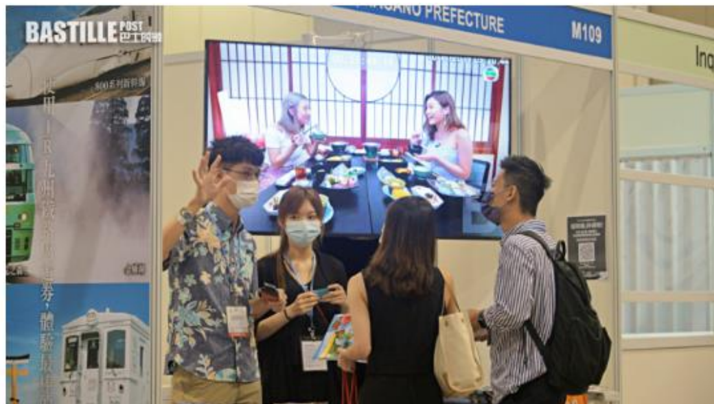
第36屆香港國際旅遊展下周四（18日）起，一連4日在灣仔會展舉行。資料圖片

主辦方表示，今年參展國家及地區較去年增加5成，涵蓋27個國家及地區，包括內地、台灣、日、韓、泰國及加拿大等，期望展覽為旅遊業界提供便利的場合，推動旅遊業復甦。展覽期間將舉辦逾50場旅遊講座，介紹各熱門旅遊地方及旅遊安全等資訊。