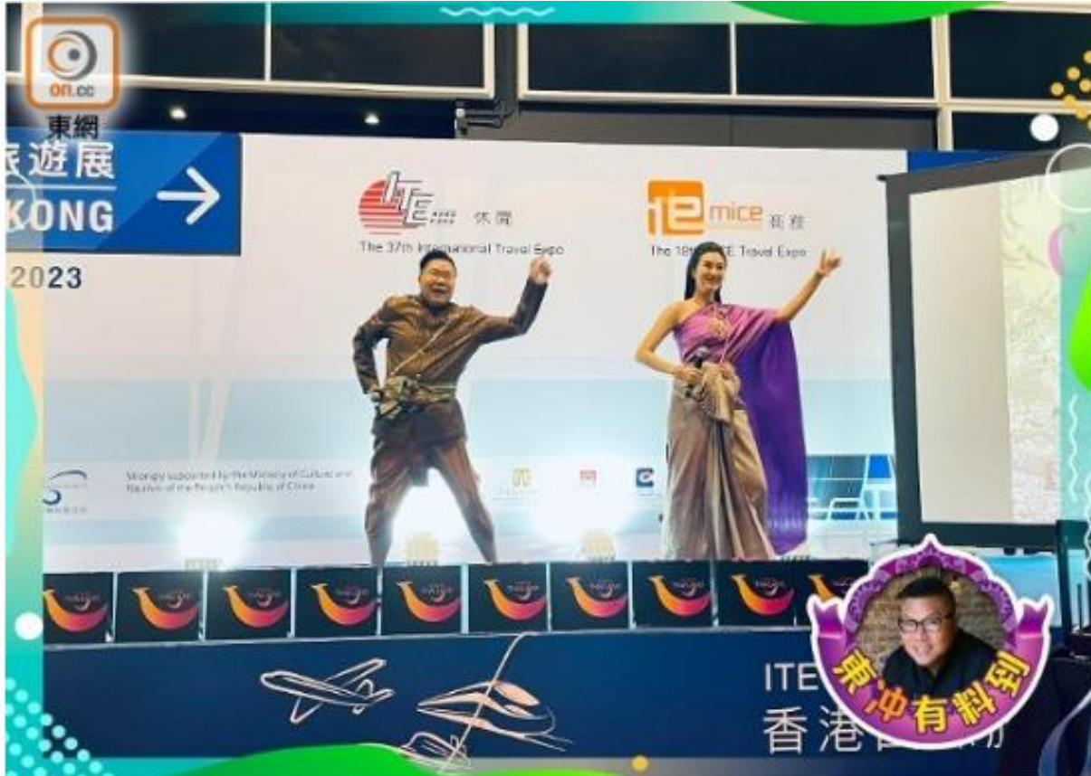
闊別三年，我跟冬蔭妹今年再次出席香港國際旅遊展，於會展台上載歌載舞娛樂大家。