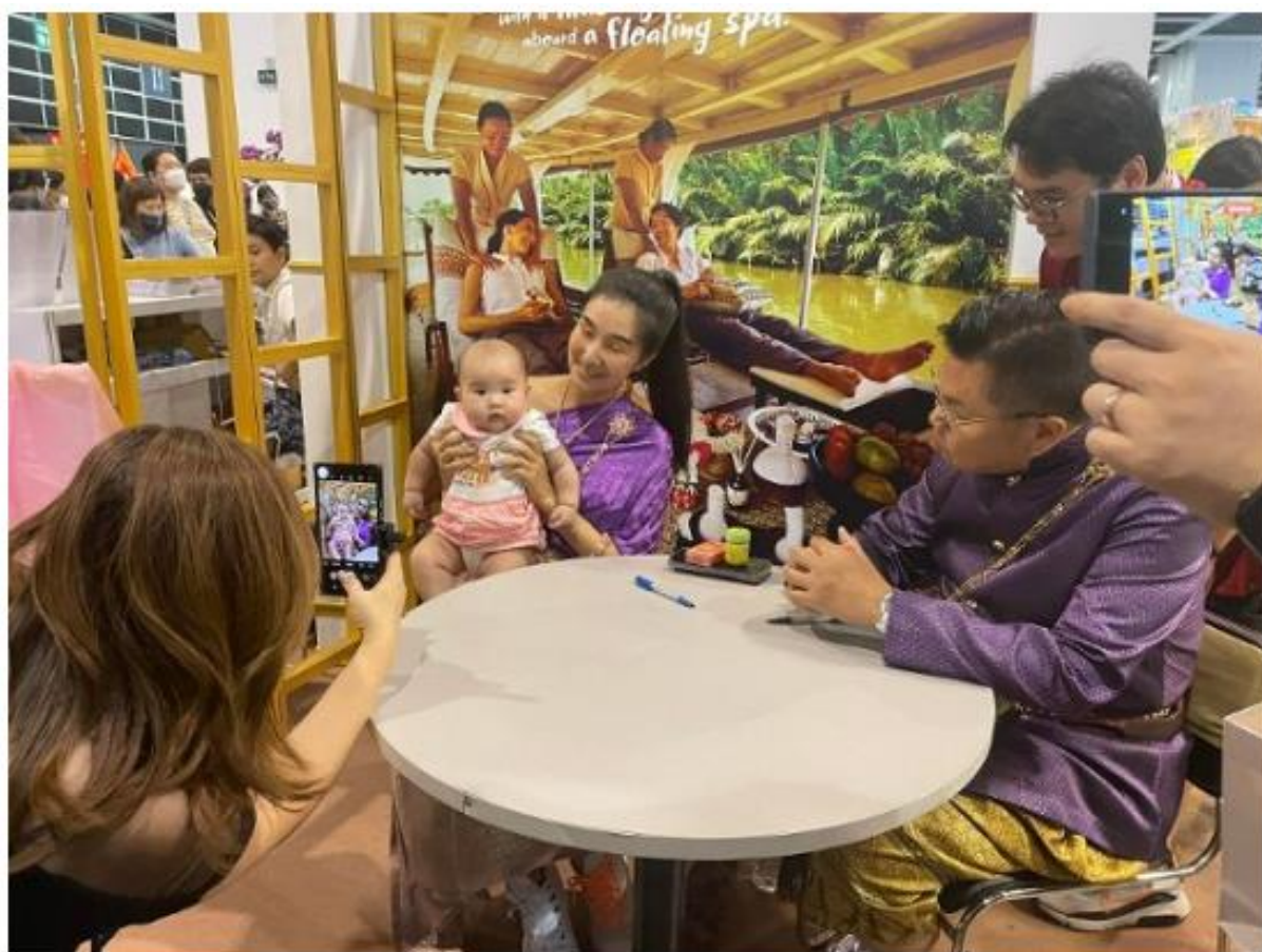
已經懷了BB的冬蔭妹依然被大讚好靚女。