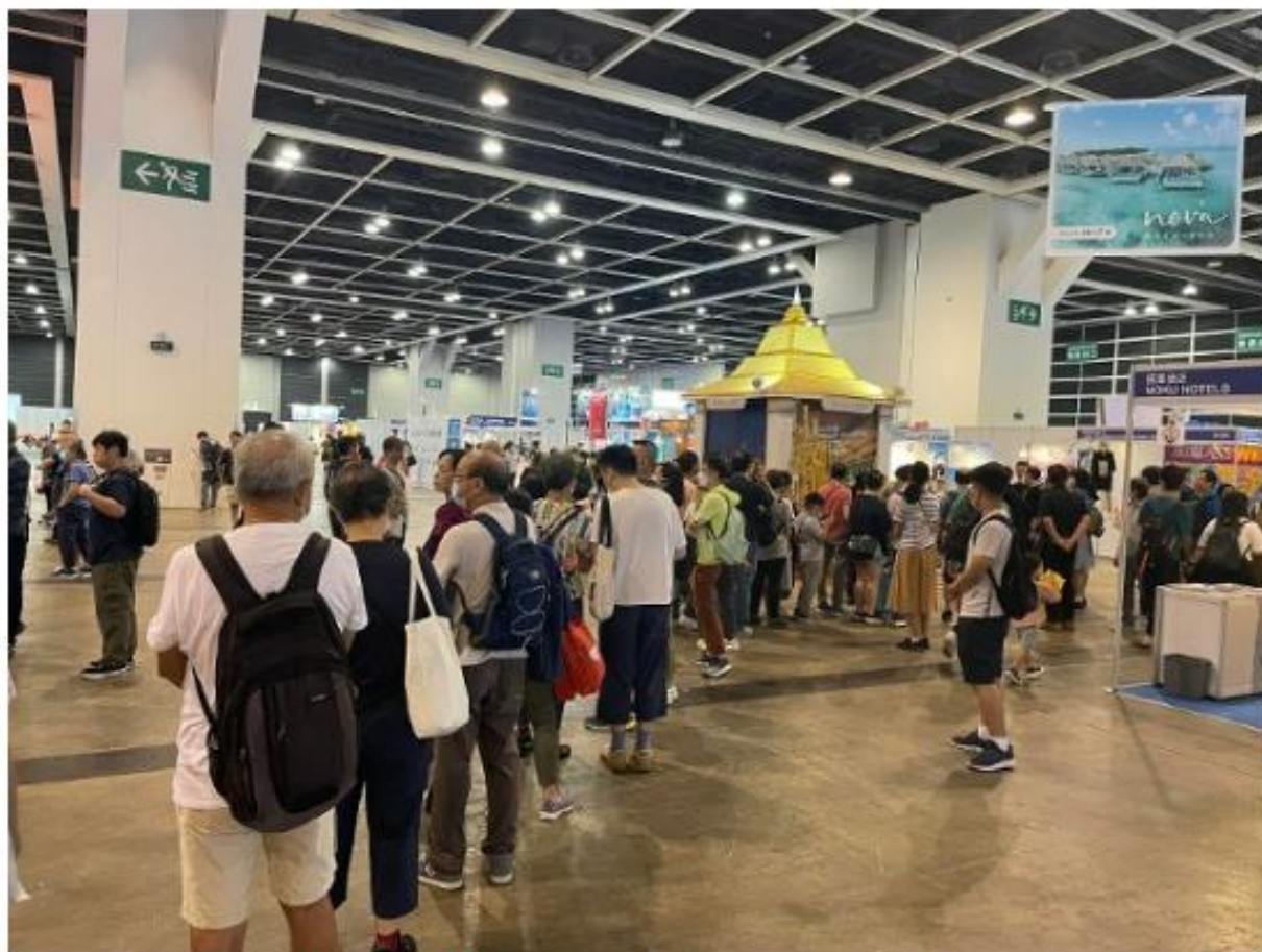
好多市民前來會場參觀擺禮品兼參與講座。