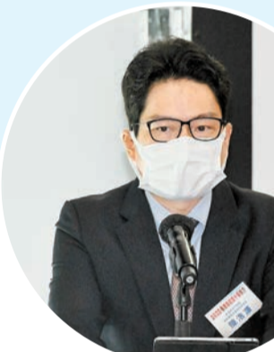
陳浩濂表示，港府會增加資源幫助業界開拓文化、古蹟、綠色及具香港特色的旅遊項目。

【香港商報訊】記者黃兆琦、鄧江紅、張穎胤報導：「2022 香港旅遊業十優推介頒獎典禮」昨日在會展中心圓滿舉行，14家旅遊企業因為在疫下寒冬之中絕不躺平的卓越表現，展現出專業拼搏精神而榮獲殊榮，獲頒十優大獎。